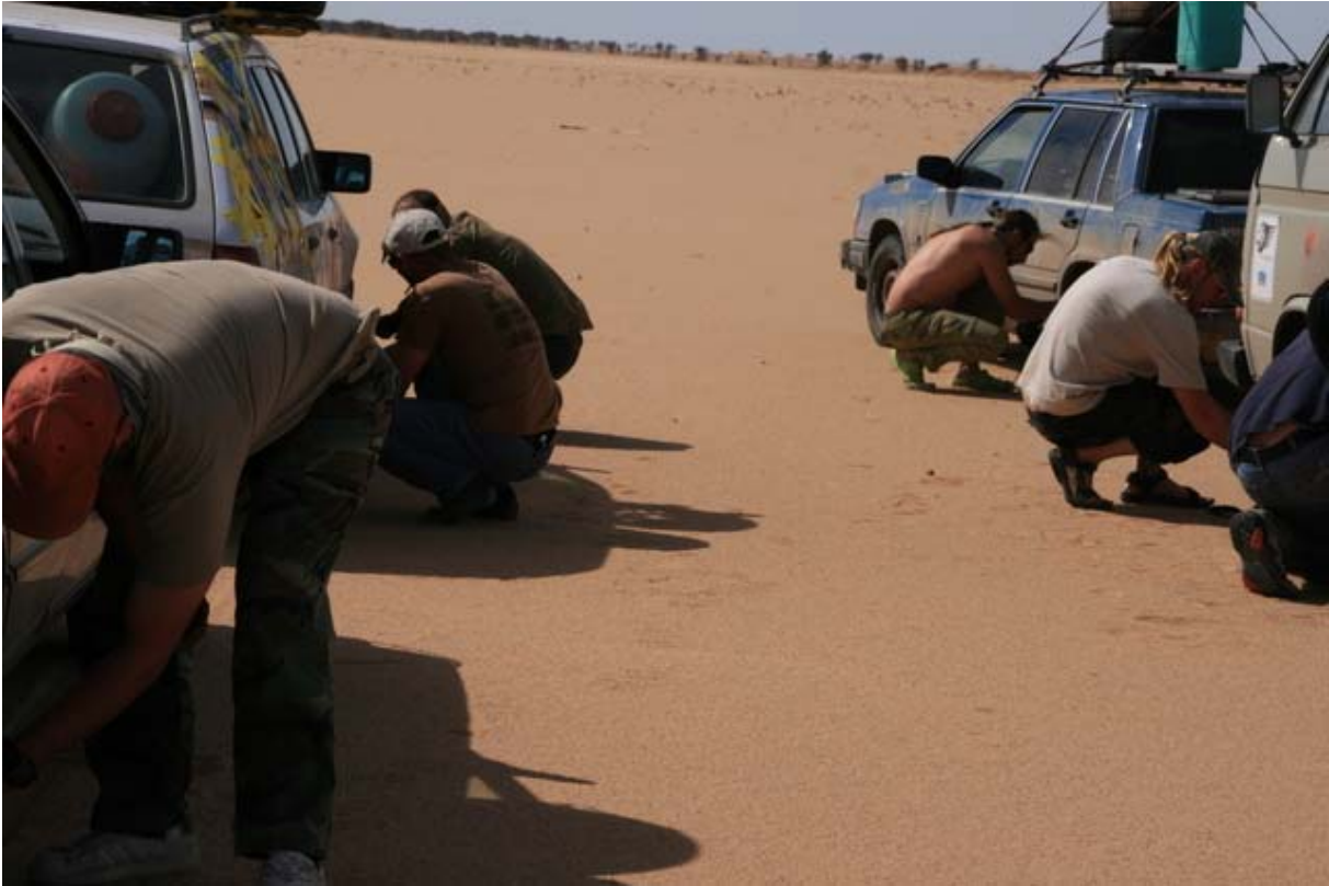
Vorerst ist der Untergrund noch gut befahrbar...